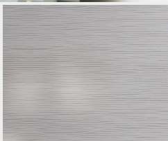
Wood 2 DQ